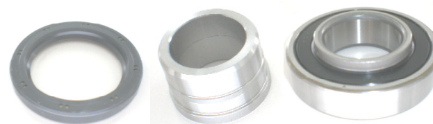
Uszczelnienie Tuleja dystansowa Łożysko