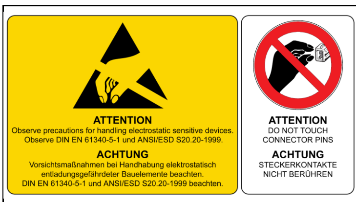
4 - ESD Hinweise / ESD Notes