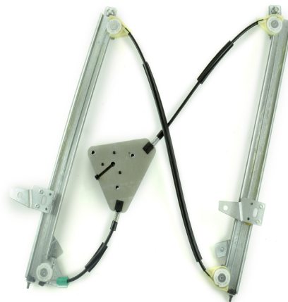
Our window regulator - notre lève-vitre - unser Fensterheber - nuestro elevalunas- nosso levantator de vidro - Γρύλος γνήσιος - nostro alzacrystallo