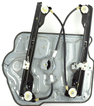
oem window regulator - lève-vitre original - Fensterheber von oem - elevalunas original - levantator de vidro original - Γρύλος γνήσιος - alzacrystallo originale