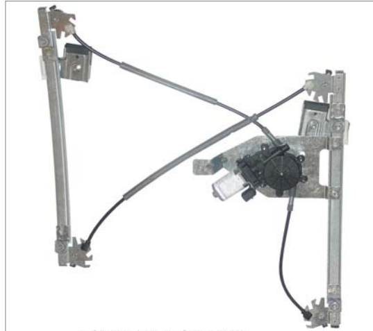
POWER WINDOW LEFT ALZACRISTALLI ELETTRICO SX

LA PRESENTE ISTRUZIONE VALE SIA PER IL LATO SINISTRO CHE PER IL LATO DESTRO.