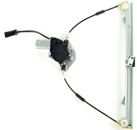
Our window regulator - notre lève-vitre - unser Fensterheber - nuestro elevalunas- nosso levantator de vidro - Γρύλος γνήσιος - nostro alzacristallo