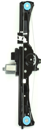
Oem window regulator - lève-vitre original - Fensterheber von oem - elevalunas original - levantator de vidro original - Γρύλος γνήσιος - alzacrystallo originale

Citroen Nemo - 12/07 -> Peugeot Bipper - 12/07 -> Fiat Fiorino - 12/07 -> Fiat Qubo - 12/07 ->