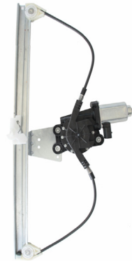
Our window regulator - notre lève-vitre - unser Fensterheber - nuestro elevalunas- nosso levantator de vidro - Γρύλος γνήσιος - nostro alzacrystallo