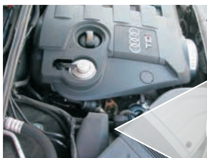
Przykład: Sprężarka o zmiennej geometrii turbiny i przetwornik ciśnienia (kolor czerwony) w Audi A4 TDI