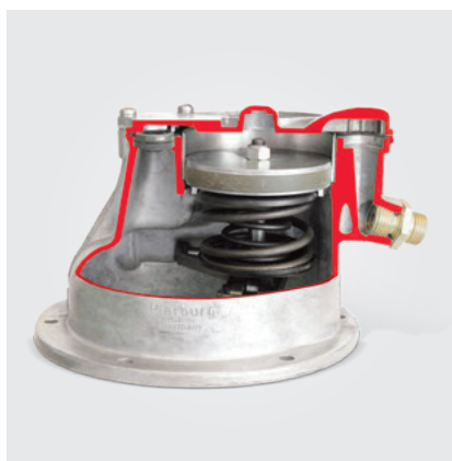
Klasyczna pompa próżniowa tłokowa (model w przekroju)

Dalsza eksploatacja używanej pompy próżniowej w wyremontowanym silniku: Pompy próżniowe są połączone z silnikiem i zostają przyłączone w zależności od wariantu konstrukcyjnego do obiegu oleju silnikowego. Po awarii silnika mogą wystąpić następujące sytuacje: