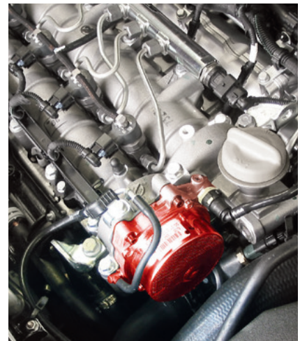
Pompa próżniowa w pojeździe Opel Vectra C (wyróżniona)

Prawo do zmian i odchyłeń rysunków zastrzeżone. Przyprządkowanie i części zastępcze patrz obowiązujące katalogi lub systemy oparte na danych TecAlliance.