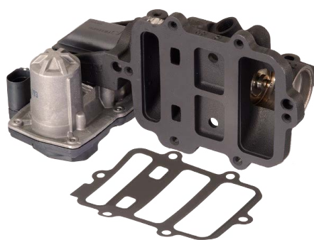
Zawór EGR z uszczelką (nr art. 7.04999.34.0)

Możliwe przyczyny silnych osadów sadzy są podane w naszym informatorze „Service Information SI 0100”.