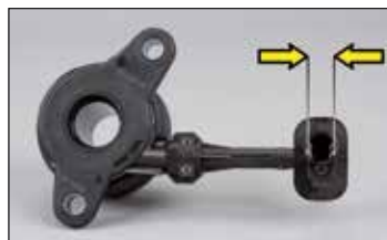
Figur 1: LuK CSC 510 0090 10 hydraulisk tilkobling 12.2 mm