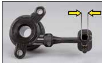
Figur 3: LuK CSC 510 0098 10 hydraulisk tilkobling 11.7 mm