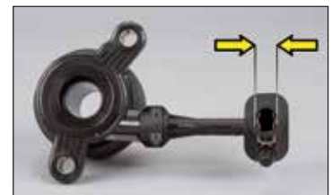
Figur 2: LuK CSC 510 0097 10 hydraulisk tilkobling 13.3 mm