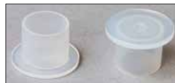
Figur 2: Lukkeplugger

Bruk ikke slagtrekker når du jobber med DMF! Kontroller nålelaget i veivakselen!