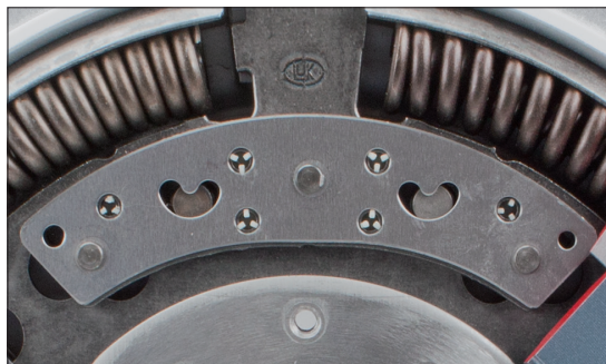
Foto2: Element wahadła

Zwiększone tłumienie drgań na niskich prędkościach obrotowych jest osiągnięte dzięki zamontowaniu dodatkowych wahadełek, które nie zwiększają gabarytów koła. Pozwala to nowym silnikom na osiągnięcie ich pełnego potencjału w związku z ograniczeniem spalania i emisji CO 2 zapewniając komfort pracy układu napędowego.