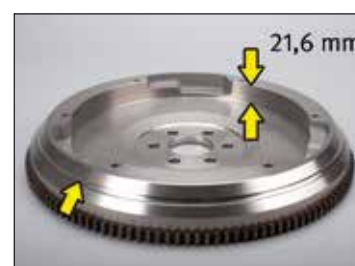
Figur 2: OE nr.: 93186460/5616016 med innhakk rundt omkretsen, svinghjuldybde 21,6 mm

De ulike egenskapene for svinghjulene fremgår av illustrasjon 1 og 2.