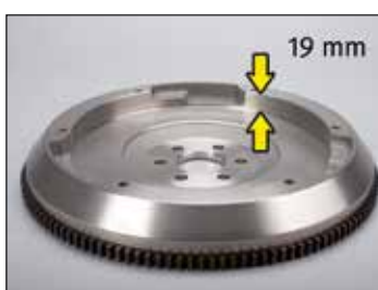
Figur 1: OE nr.: 90536140/616169 uten innhakk rundt omkretsen, svinghjuldybde 19 mm