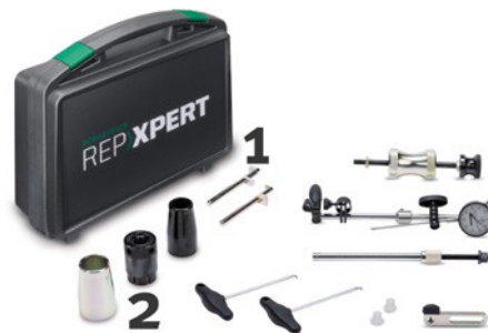
Rysunek 2: Poprzedni zestaw narzędzi specjalnych LuK 400 0540 10