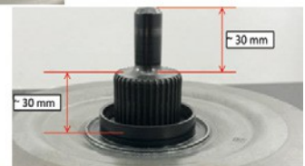
Rysunek 3: Zmodyfikowane wymiary uzębienia i sworznia prowadzącego