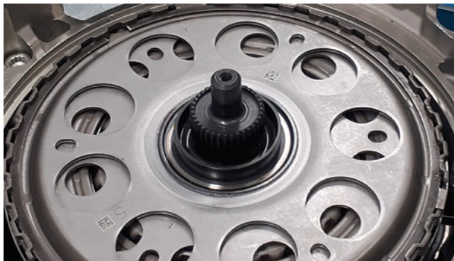
Rysunek 1: Tarcza napędowa z okrągłymi otworami

Poprzedni wspornik do skrzyń biegów DQ 380/81 i DQ 500 (1 na rysunku 2) nie pasuje do tej wersji. Do montażu należy użyć zmodyfikowanej śruby mocującej. Jest ona teraz również dołączona do każdego nowego zestawu narzędzi specjalnych LuK 400 0540 10.