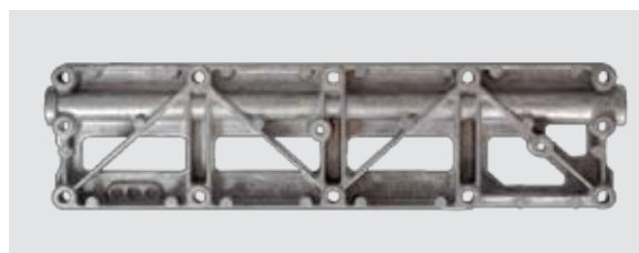
Rys. 2_Wcześniejsza wersja Land Rover nr części: LCN100230