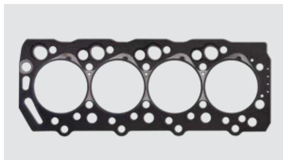
Figura 1: 61-52252-00 (junta de culata utilizada hasta la fecha)