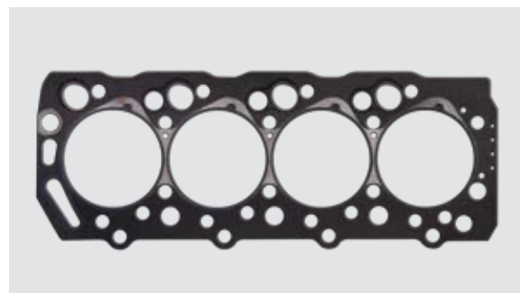
Rys. 1_61-52252-00 (dotychczasowa uszczelka głowicy cylindra)