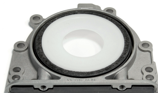
Иллюстрация 2_Встроенное уплотнение вала: нижняя сторона

VICTOR REINZ - наилучший путь к хорошему уплотнению.