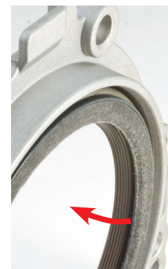
Rys. 2 _Krawędź uszczelniająca skierowana do wnętrza silnika