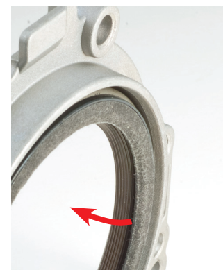
Figura 2_0 lábio de vedação está virado para o interior do motor