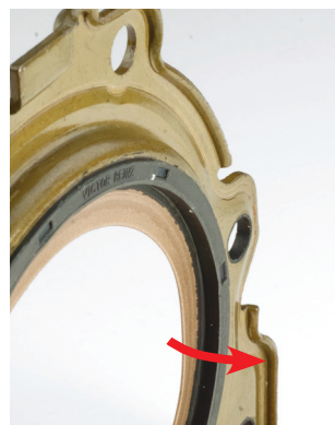
Figura 1_0 lábio de vedação está virado para a caixa de velocidades

Observe impreterivelmente as instruções de montagem dos anéis retentores de PTFE do veio incluídas no conjunto de vedação.