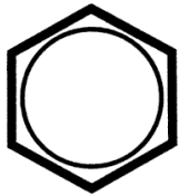
760.720 M 9x1,25x96

Schraubenkopf / Head shape Anziehreihenfolge/Tightening sequence/Ordre de serrage/Orden de apriete Tête de vis / Cabeza de tornillo