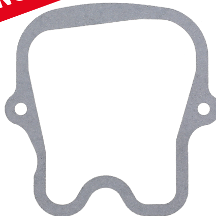
NOVA 638.901 – MAN 51.03905.0134 Materiał: EWP 407 szary (materiał miękki)