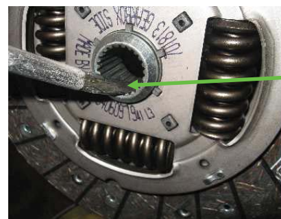
Použijte malé množství tuku