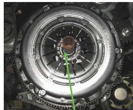
Přípravek pro vystředění