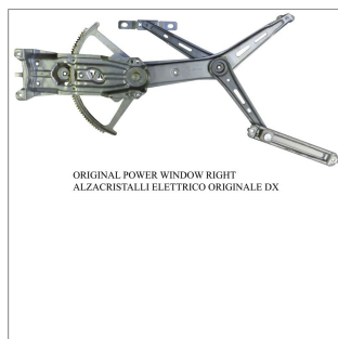
ORIGINAL POWER WINDOW RIGHT ALZACRISTALLI ELETTRICO ORIGINALE DX

Lève-vitre d'origine / Original-Fensterheber Alzacristalli originale / Elevallunas original