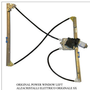
ORIGINAL POWER WINDOW LEFT ALZACRISTALLI ELETTRICO ORIGINALE SX

Lève-vitre d'origine / Original-Fensterheber Alzacristalli originale / Elevavinas original