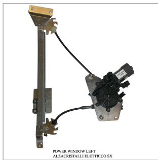
POWER WINDOW LEFT ALZACRISTALLI ELETTRICI SX

Lève-vitre de remplacement / Ersatz-Fensterheber Alzacristalli di ricambio / Elevavinas de recambio