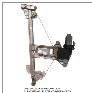
ORIGINAL POWER WINDOW LEFT ALZACRISTALLI ELETTRICI ORIGINALE SX

Lève-vitre d'origine / Original-Fensterheber Alzacristalli originale / Elevavinas original