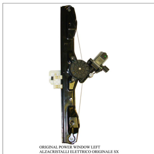
ORIGINAL POWER WINDOW LEFT ALZACRISTALLI ELETTRICI ORIGINALE SX

Lève-vitre d'origine / Original-Fensterheber Alzacristalli originale / Elevavinas original