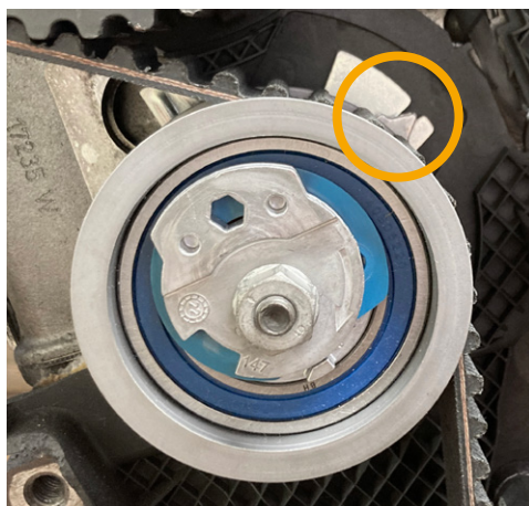
Fig.1: Versión 1

El rodillo tensor suministrado V55739 puede tener un aspecto diferente del que se encuentra instalado en el vehículo. Existen dos versiones diferentes: