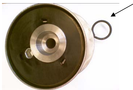
Bild 2 Spännrulle utan låsstift