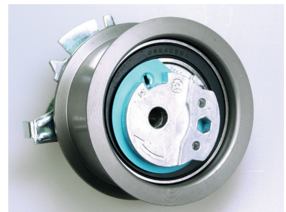
Obr. 1 Dosavadní provedení kladek

Dodaná napínací kladka V56340 se odlišuje opticky od kladky zabudované ve vozidle a nelze ji zdánlivě správně upnout.