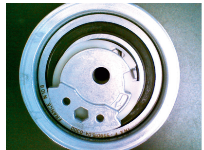
Bild 2 Nytt utförande av löprulle

Ursprungligen monteras en löprulle med en konstruktion som på bild. 1. En något modifierad remspännare levereras för eftermarknaden - se bild 2.