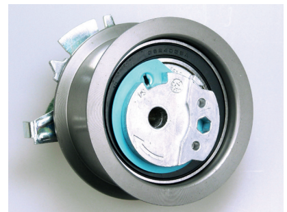
Bild 1 Tidigare utförande av löprulle

Den levererade V56340 remspännaren skiljer sig visuellt från den löprulle som är monterad i bilen och det verkar som att den inte går att spänna korrekt.