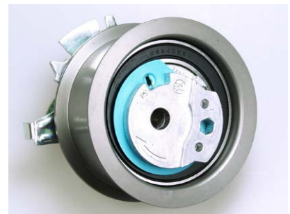
Rys. 1 Poprzednie wykonanie rolki

Dostarczana w zestawach rolka napinająca V56340 różni się wizualnie od montowanej w tych silnikach i wydaje się być niemożliwa do napięcia.