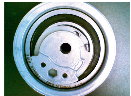
Fig. 2 «Novo» modelo de rolamento

Na versão de fábrica, o rolamento é idêntico ao mostrado na Fig. 1. Não obstante, no mercado de reposições está incluído um rolamento tensor ligeiramente modificado, ver a Fig. 2.