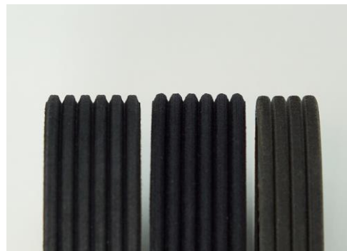
De ändrade profiltyperna – svåra att se med blotta ögat

Starkt förstordad vy över de olika profilerna