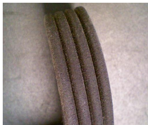
Exempel på en ändrad multiribbrem

De ändrade remmarna kan oreserverat användas för de fordonsapplikationer som anges i våra rekommendationer. Det nya utförandet har inga prestandanackdelar, trots det annorlunda utseendet.