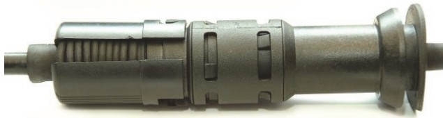
Abb. 1: Sicherung mit Bajonettverschluss