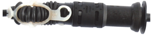
Abb. 2: Sicherung mit Kunststoffverschluss

Seilzüge mit automatischem Nachstellmechanismus sind mit einem Bajonettverschluss (Abb. 1) oder einem weißen Kunststoffband (Abb. 2) gesichert.