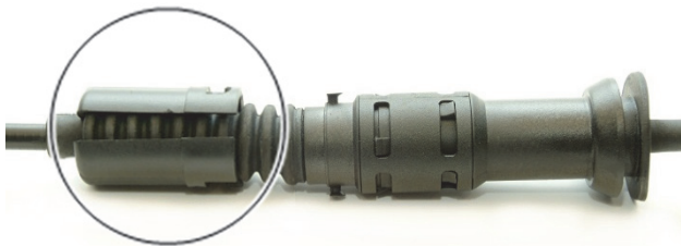
Abb. 3: Sicherung gelöst

→ Der Seilzug stellt sich nach Betätigung des Kupplungspedals automatisch nach.