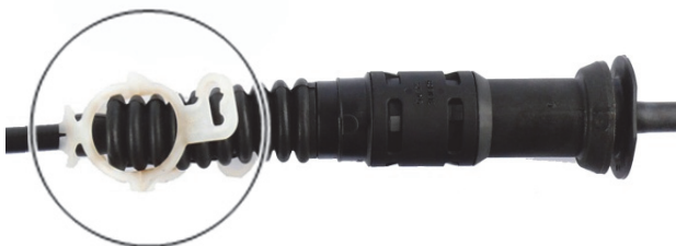
Abb. 5: Sicherung gelöst

→ Der Seilzug stellt sich nach Betätigung des Kupplungspedals automatisch nach.