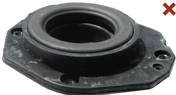
Fig. 1: Nieprawidłowo zamontowane łożysko oporowe amortyzatora teleskopowego

Citroën Berlingo / Xsara / ZX Peugeot 306 / Partner