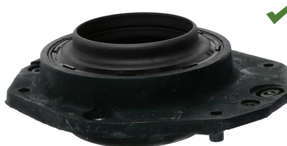
Fig. 2: Prawidłowo zamontowane łożysko oporowe amortyzatora teleskopowego