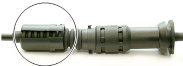
Rys. 3: Zabezpieczenie otwarte

→ Po uruchomieniu pedału sprzęgła linka automatycznie nastawia się.