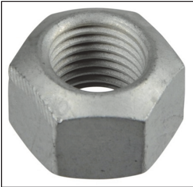
Abb. 1: Ganzmetallsicherungsmuttern M14x1,5