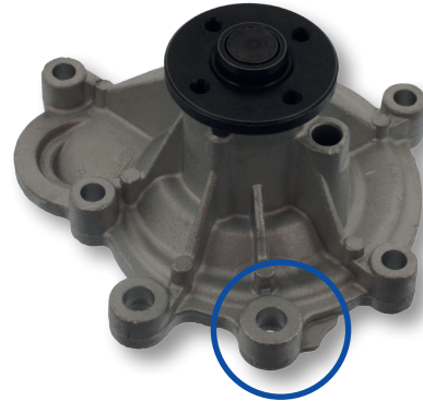
Neue Version / New version