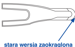
stara wersja zaokrąglona

Proszę spytać lokalnego partnera handlowego SWAG o części zamienne SWAG! Wszystkie części zamienne można znaleźć też na www.swag.de .