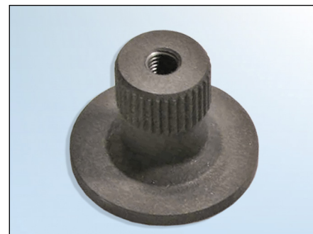
Figur 2: Adapter 30648510

Dra til festeskrue med det tildragningsmomentet som er foreskrevet av kjøretøysprodusenten!