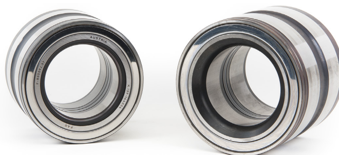
Foto 1: Moduł piasty z uszczelką (po lewej) lub z wyobleniem krawędzi (po prawej)

Nr referencji: 805003CA.H195 805011C 805012.06.H195 805092.07 571762.01.H195 803194.26 805003A.H195