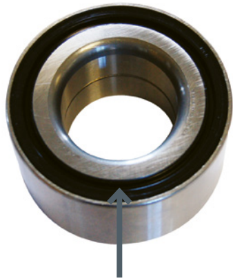
Bearing Oil Seal (Rubber)