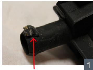
Altes Kunststoff Old plastic

to fit: Ford Various Models Mazda 121 96-03