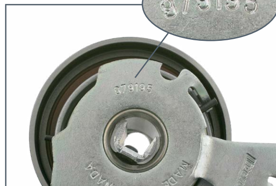
febi 23429 / SWAG 40 92 3429