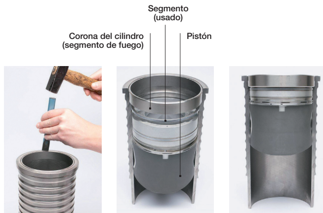
Figura 1: Desmontaje destructivo del segmento de fuego

Desmontaje no destructivo: Si la camisa de cilindro y el segmento de fuego deben reutilizarse, el pistón debe llevarse al punto muerto inferior girando el cigüeñal. A continuación, se puede insertar bajo el segmento de fuego un segmento de pistón usado con el diámetro de la camisa de cilindro. Una galga de espesores salva la holgura y evita que el segmento de pistón se comprima y se deslice sobre el segmento de fuego. Si la camisa de cilindro no debe cambiarse, debe fijarse en su asiento con un contrasoporte. Al girar el cigüeñal, el pistón se mueve en la dirección del punto muerto superior y, por lo tanto, hacia la herramienta de extracción, que empuja suavemente el segmento de fuego.