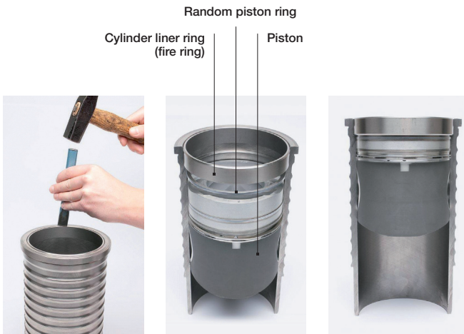
Figure 1: Destructive removal

Nondestructive removal: If the cylinder liner and fire ring are to be reused, the piston must be moved to bottom dead center by turning the crankshaft. Then, a used piston ring with the same diameter as the cylinder liner is inserted under the fire ring. A feeler gauge can be used to bridge the gap clearance and prevent the piston ring from becoming compressed and sliding over the fire ring. If the cylinder liner is not to be replaced, it must be fixed in place using a hold-down tool. When the crankshaft is turned, it moves the piston in the direction of top dead center, causing it to gently push out the fire ring in the process.