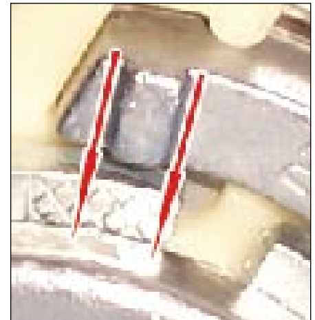
Fot. 5: Oba znaki są poza rowkiem (strzałka). Powtórzyć regulację napięcia!