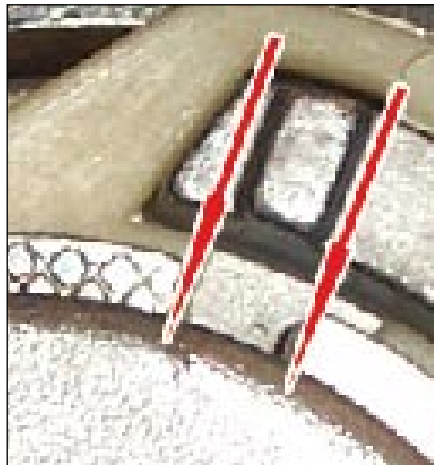
Fot. 4: Oba znaki pokrywają się z rowkiem (strzałka). Montaż jest prawidłowy!

W celu zapewnienia właściwego działania wskaźnika zużycia, wszystkie elementy jak pasek, napinacz i rolki prowadzące, muszą być wymieniane jednocześnie. LuK zaleca stosowanie zestawu z paskiem tzw. KIT (Nr LuK: 530 0082 10 ), z uwagi na jednakowe zużycie wszystkich rolek. W przypadku posiadania właściwego paska rozrzędu w jakości OE, zaleca się stosowanie zestawu rolek bez paska tzw. SET (Nr LuK: 530 0082 09 ).