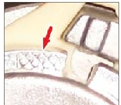
Fot. 3: Kratownica

Wskaźnik ten charakteryzuje wytłoczona kratka obok szczeliny nastawnej napinacza (fot. 3).