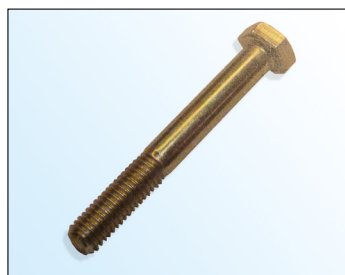
Figur 2: OE-bolt