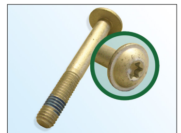
Figur 3: LuK AS bolt

■ Vær nøye med kjøretøysproduzentenes angivelser!