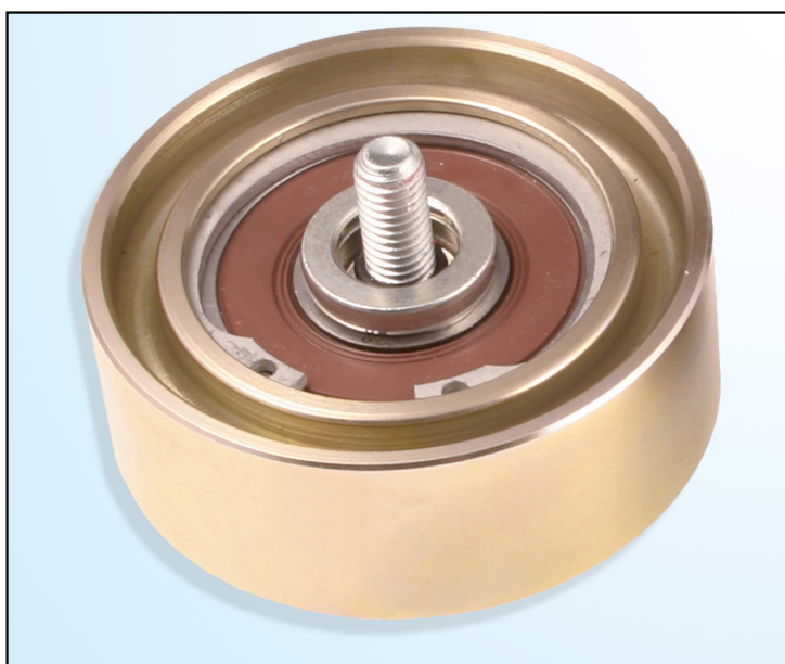
Figur 2: 532 0294 10 (ny versjon)

Til tross for sine ulike versjoner, er begge styrerullene fullt kompatible med kjøretøyene som er indikert i katalogen.